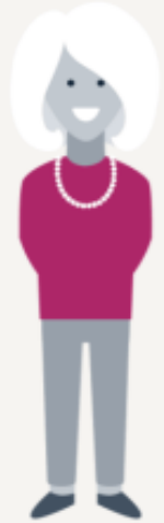
Builders Born: < 1946